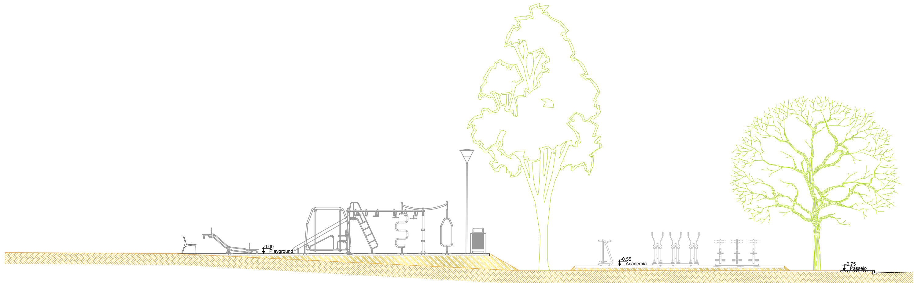
CORTE DD Escala 1:100